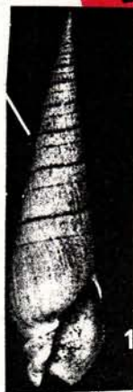
1 Terebra plicaria .