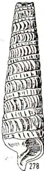
Fig. Nr. 278

Terebra (Myurellina) neglecta MICHELOTTI 1847 Twistringer Schichten, Woltrup Sammlung ANDERSON, Kat. Nr. Wp 13