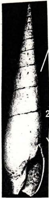
2 T. modesta , BOUCHET 1981