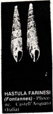
HASTULA FARNESI (Fontannes) - Pliocene, Castell'Arquato (Italia) Ausey Pl. 15