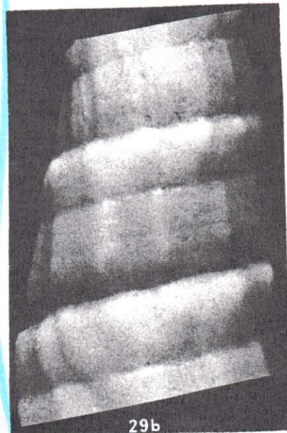
T. sowerbyana Deshayes. 29a, Holotype British Museum (N.H.), No. 197973; 56.3 mm. 29b, Middle whorls.