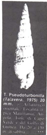
T. Pseudoturbonilla (Talavera, 1975) 20 mm. - Atlántico oriental. Localidad típica Mauritania, An- gola, Isole di Capo Verde e del Golfo di Guinea. Da 20 a 130 m. in sabbia. ***