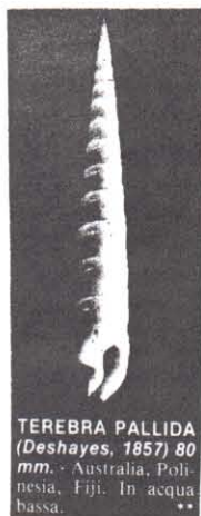
TEREBRA PALLIDA (Deshayes, 1857) 80 mm. - Australia, Pol- nesia, Fiji. In aqua bassa. **