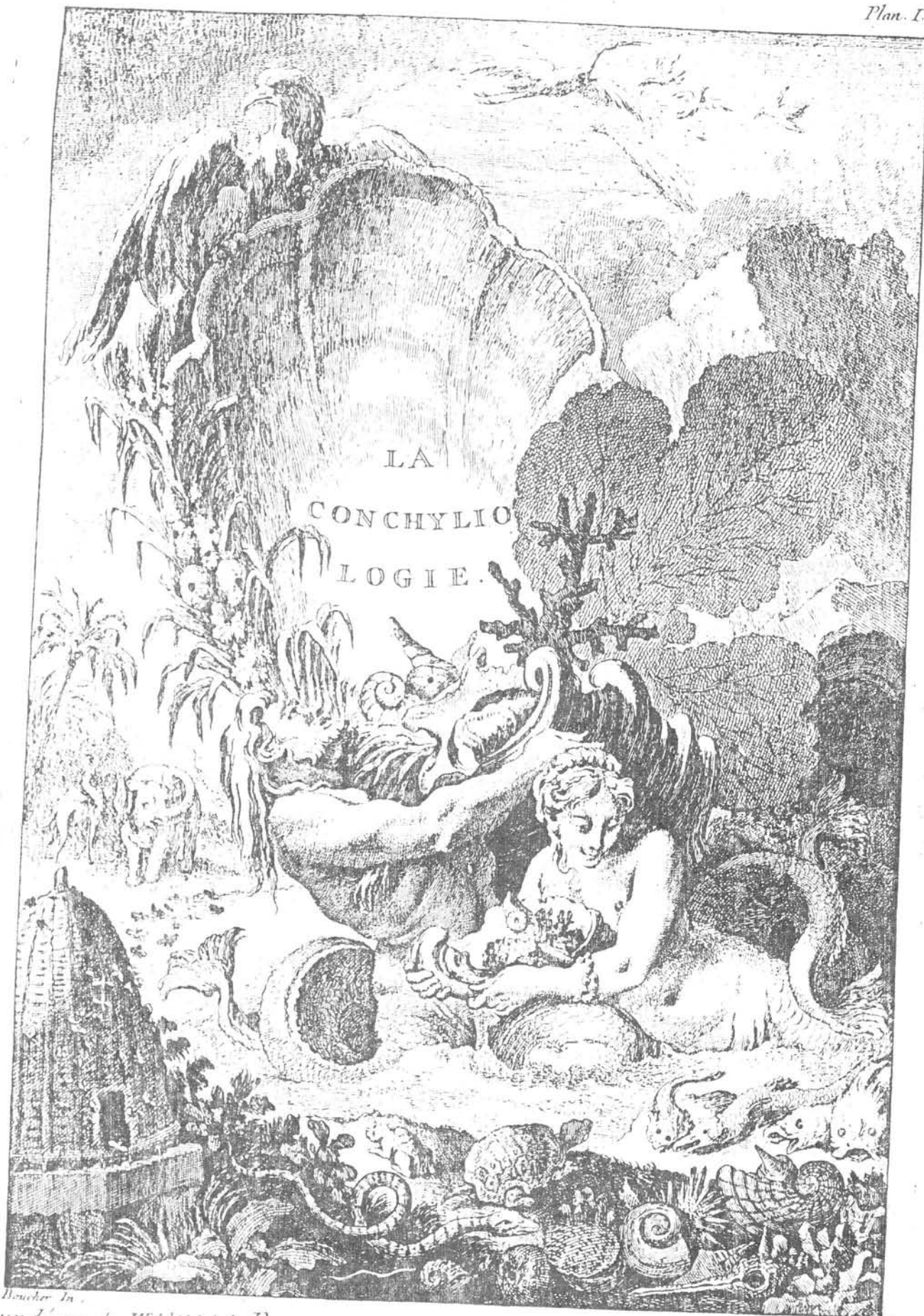
Boucher In. aux dépens de M. l'abbé de Pomponne, cons. er d'état ord. er command. er et chancelier des Ordres du Roy. Goussier sculpat.